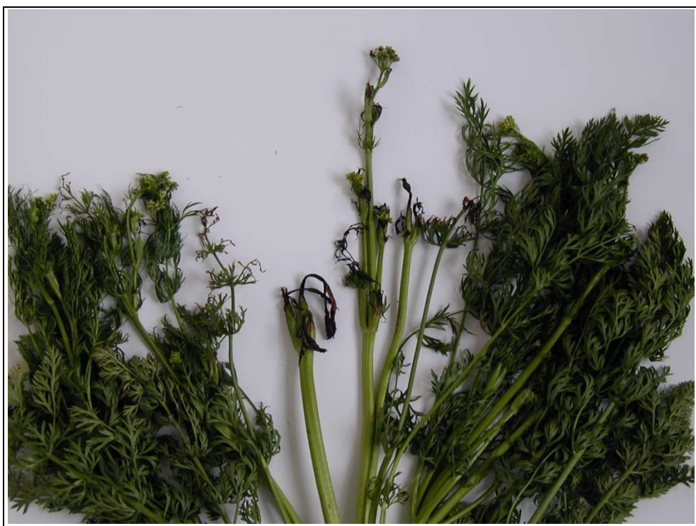
Obrázek č. 6: Bakteriální spála vegetačních vrcholů a květenství - původci Erwinia , Pseudomonas , Xanthomonas